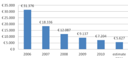
Totaal kosten wisseldrukmatrassen Eveen verpleeghuizen

Effectief daalde het aantal hieldecubituswonden met 42,7%, dat is met 16,55% van het totaal ver onder het landelijke gemiddelde van 32,3% . De totale decubitusprevalentie ( exclusief classificatie I) daalde in de Eveen verpleeghuizen van 12,1% in 2005 naar 5,2% in 2011.