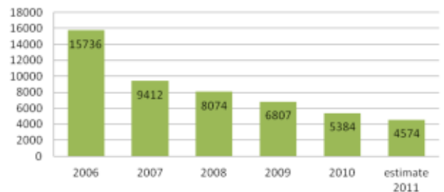
Aantal ligdagen wisseldrukmatrassen Eveen thuiszorg

Zonder de indicatiestelling door het team van Henri werden er gemiddeld 1750 weken statische systemen ingezet en door de indicatiestellingen is dit teruggebracht naar gemiddeld 250 weken! Henri zegt " We blijven continue op zoek naar verdere verbeteringen, deze resultaten nodigen daartoe uit. Door op eenvoudige wijze met een goed basismatras, wisselhouding om de 4 uur en de hielen vrij te leggen zijn deze geweldige resultaten gerealiseerd. Het is zaak om goed vol te houden en de zorg voor onze cliënten zo optimaal mogelijk uit te voeren. Mogelijk kan het dan nog ietsje "lager"! November 2011